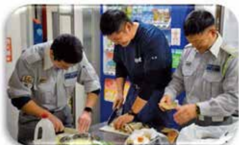
この日の夕食のメニューはキーマカレー なかなかの腕前です

消防士の仕事は、消火・救助・救急・予防など様々な分野に分かれていますが、住民の方々から見れば新人でも現場に出動すれば同じ消防士です。消防の業務は多くの知識、技術が求められるため、いくら学んでも勉強不足だと痛感させられる毎日です。そして、災害現場ではやり直しはできません。もし、現場でミスをするようなことがあれば最悪の場合、救える命が救えなくなり、時には自分や仲間の命も危険にさらしてしまいます。訓練で学び培ったものを現場で活かし、住民の皆さんの期待に応え感謝され、達成感や充実感を得たときはこの仕事を選んで良かったと思う瞬間です。そして何より、消防士になりたいという幼いころからの夢を実現することができた喜びやその仕事に対するやりがいは計り知れません。いつか皆さんと一緒に働ける日を楽しみにしています。