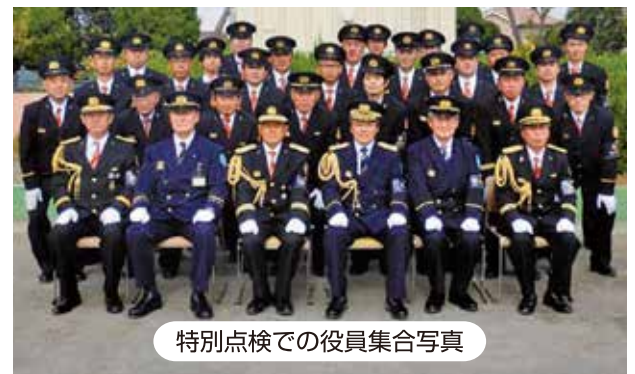
特別点検での役員集合写真

また、令和元年11月3日に行われた特別点検では、消防団員の品位や規律の保持を目的とする通常点検、いかなる時でも迅速な出動と消防活動を行うための機械器具点検、そしてポンプ車操法を披露しました。