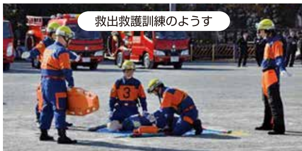
救出救護訓練のようす