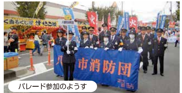
パレード参加のようす

また、令和元年11月3日に行われた特別点検では、消防団員の品位や規律の保持を目的とする通常点検、いかなる時でも迅速な出動と消防活動を行うための機械器具点検、そしてポンプ車操法を披露しました。