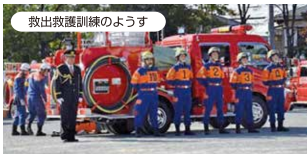
救出救護訓練のようす

令和元年11月10日に行われた草加市消防団特別点検では消防演技(救出救護訓練)を担当し、多くの御来賓、他団員の見守る中、節度ある訓練を実施し、その力を存分に発揮しました。