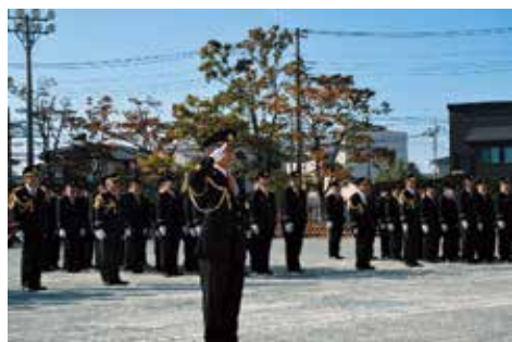
特別点検のようす

草加市消防団は女性部を含めた15の部で構成されており、218名の団員を有しています。