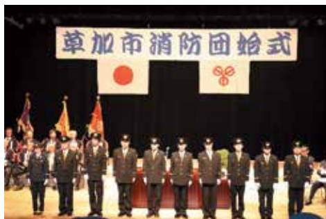
始式 新入団員の紹介