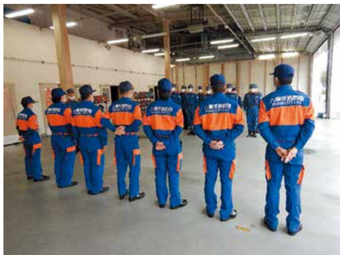
新入団員研修 職員の説明を聞く団員

八潮市消防団は女性部を含めた20の部で構成されており、212名の団員を有しています。