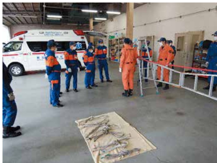
新入団員研修 ロープワークの訓練