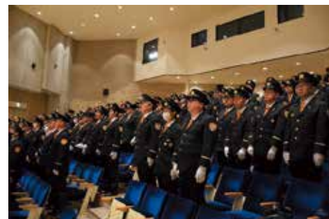
始式 出席者のようす