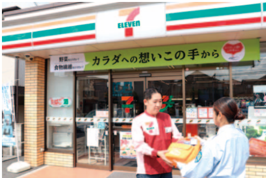
草加氷川北店での設置の様子

草加八潮消防局では、平成30年7月にセブン・イレブン・ジャパン及び草加市内のセブン・イレブン40店舗の協力のもと、新たにAED(自動体外式除細動器)を40台設置しました。