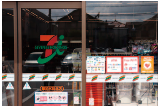
店舗出入り口付近にAED設置シールを貼付