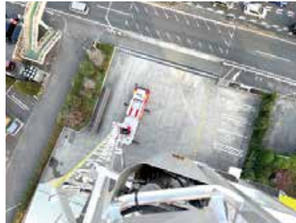
40m上空から見下ろした地上