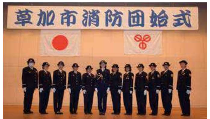
山川管理者(中央)と女性消防団員