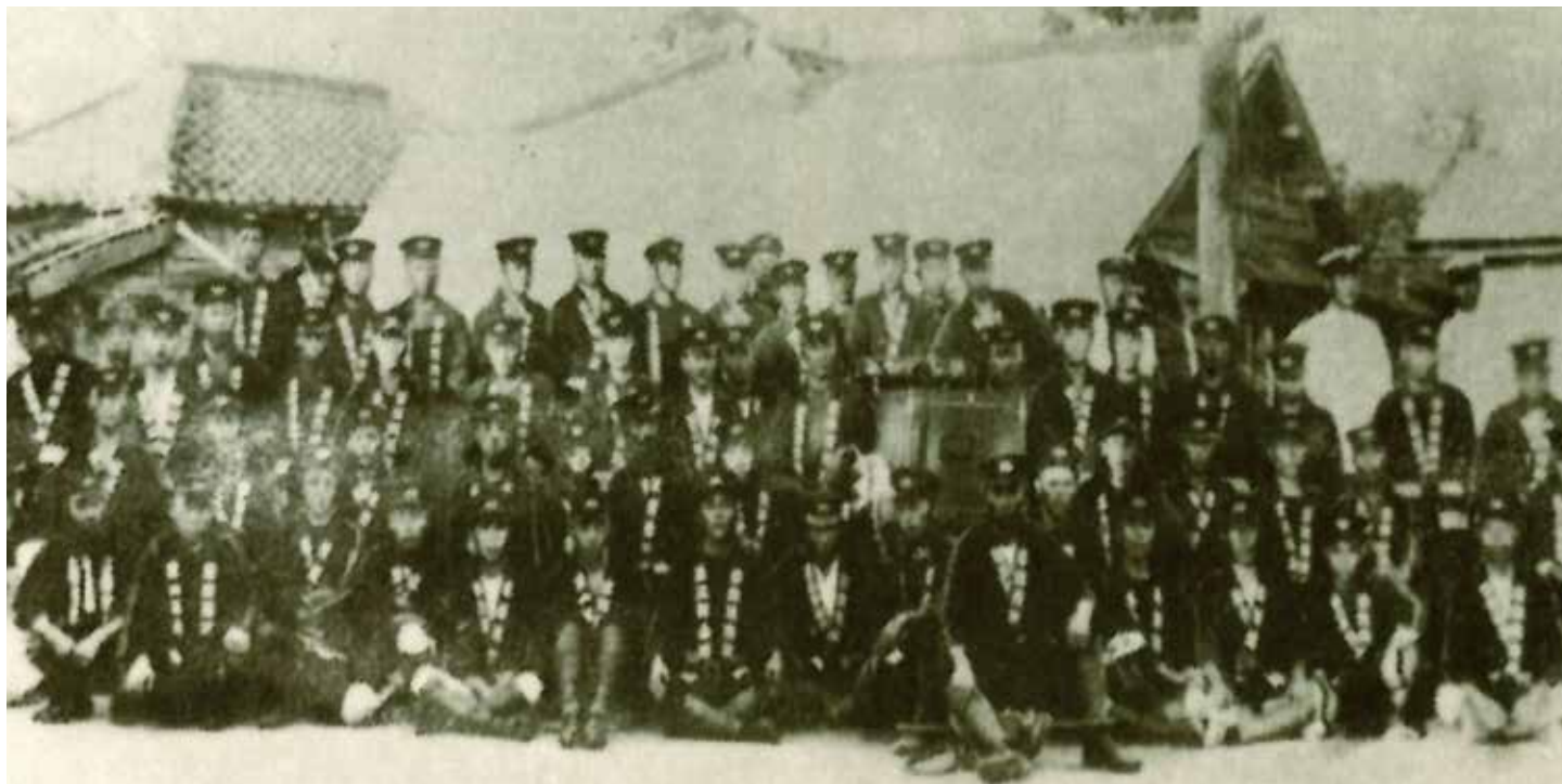
大正時代の草加消防組（現在の草加市消防団）