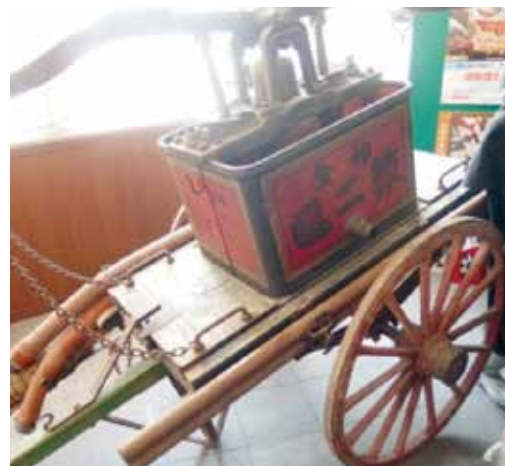
昭和初期の腕用ポンプ （八潮署展示）