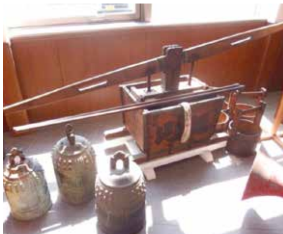
明治初期の腕用ポンプ （八潮署展示）

その後、明治に入り、町火消から消防組、昭和に入り戦時中、空襲から国民を守るため警防団と名前をかえ、そして戦後の昭和22年、今日における消防団となりました。（関連記事2面に掲載）