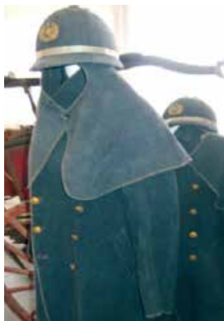
昭和初期の防火衣 （八潮署展示）