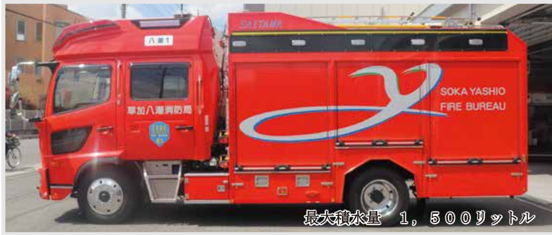
最大積水量 1,500リットル