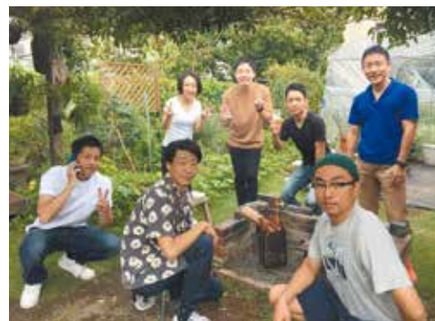
👉 直属のオシャレ先輩がこの中にいます 👈