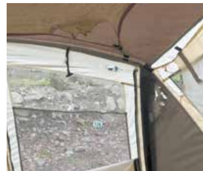
▲燃えたスクリーンタープ内部