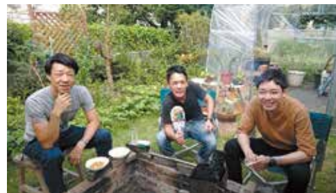
👉 職場の先輩たちとBBQ 👈

記者：確かに！忘年会での“髭男”めっちゃ上手かったです！ では、最後に未来の消防士へのメッセージをお願いします！