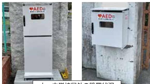
小・中学校屋外の設置状況

※消防組合のホームページにAED設置場所リーフレットを掲載しています。ぜひご覧ください！